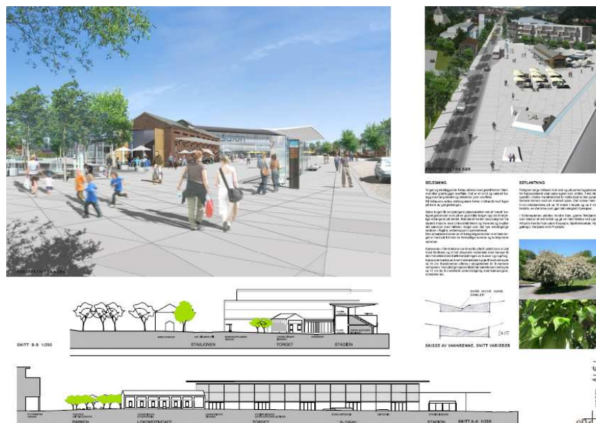
Ålè. - Motiv fra arkitektkonkurransen om torg.