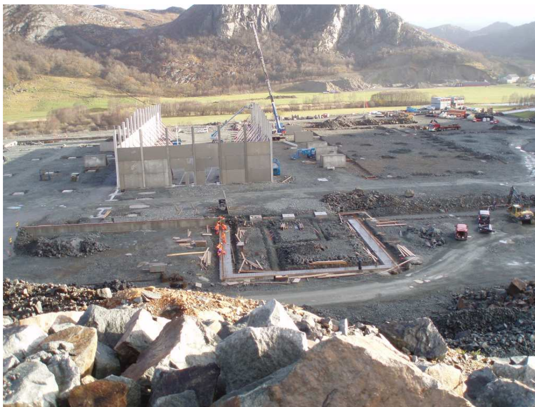
ASKO-bygget tar form.