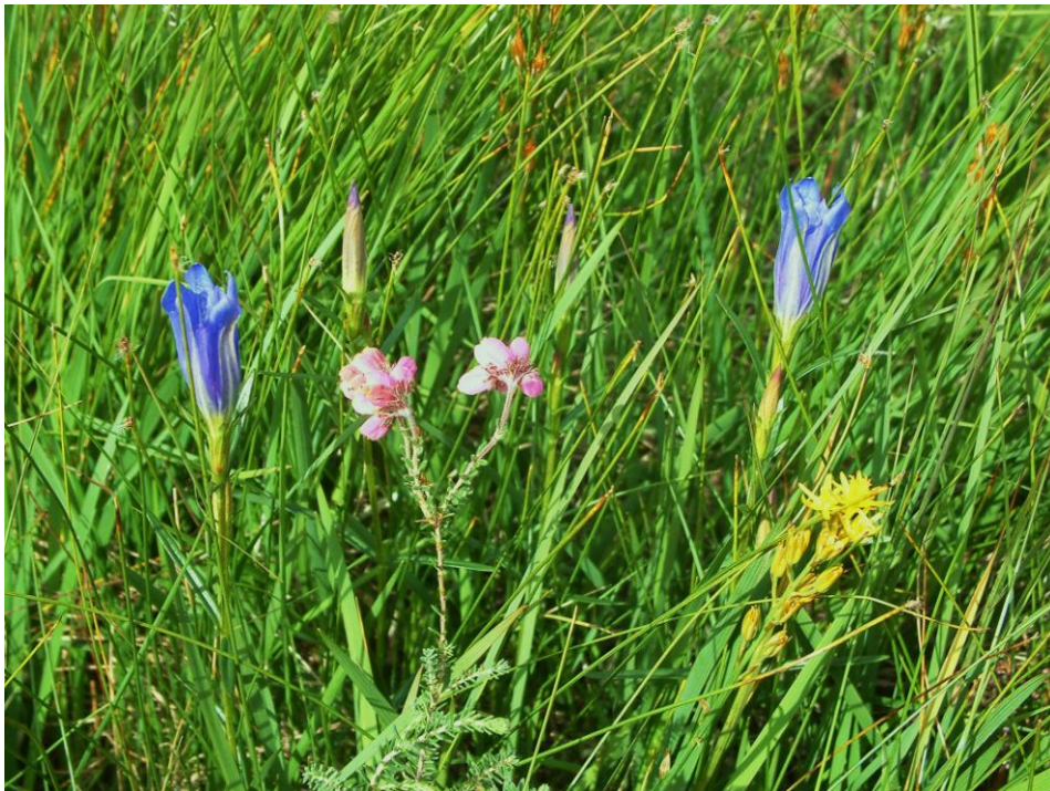
Kommuneblomsten Klokkesøte