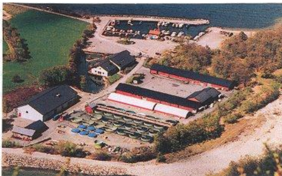
EWOS Innovation AS sitt anlegg i Dirdal

Hovudkontoret ligg her i Dirdal med stasjonar i Lønningdal i Hordaland, samt i Puerto Montt, Chile.