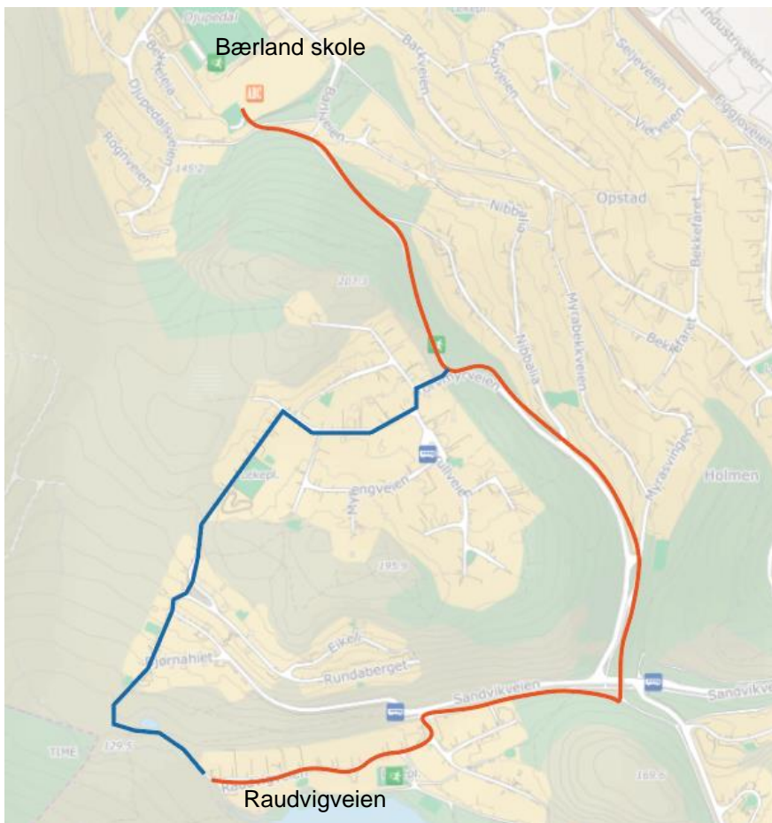
Figur 0-3 Illustrasjon som viser alternative skoleveier fra Raudvigveien til Bærland skole

Det er trolig noen barn som bor ved Raudvigveien som går Bærland barneskole. Illustrasjonen nedenfor viser to alternative gangruter fra østlig del av Raudvigveien til Sandvikveien. De alternative rutene er nesten like lange. Trasen gjennom Rundaberget er ca. 1,2 km og trasen langs Sandvikveien, Torvmyrveien, strekningen er ca. 1,3 km. Begge traseene vil trolig være i bruk. Ny kryssing vil dermed trolig være en del av skoleveien til noen barn.