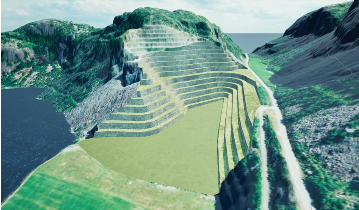
Figur 2-3 Visualisering av nytt landbruksareal ved ferdigstilling.

I kap. 2 vises også ønsket mellomlagringsområde for løsmasser (beige farge, ca. 12,5 dekar). (Gården Morka ligger i nedre, høyre hjørne, fylkesvegen i bakgrunnen):