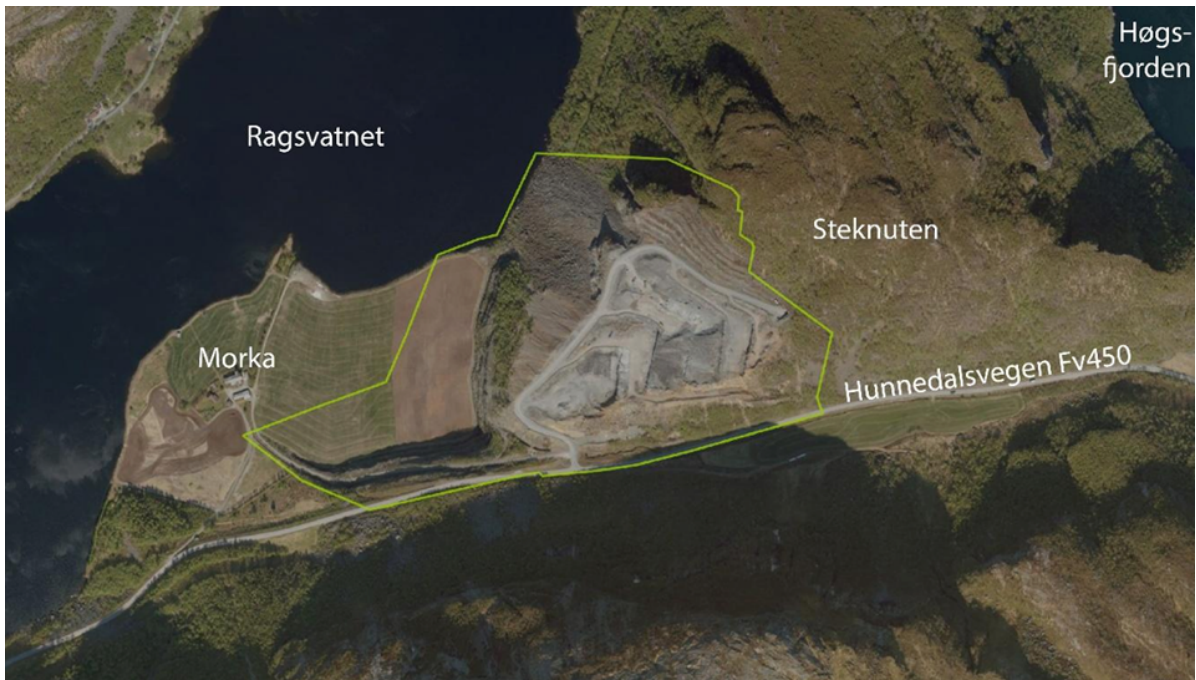
Figur 2-2 Forslag til plangrense.