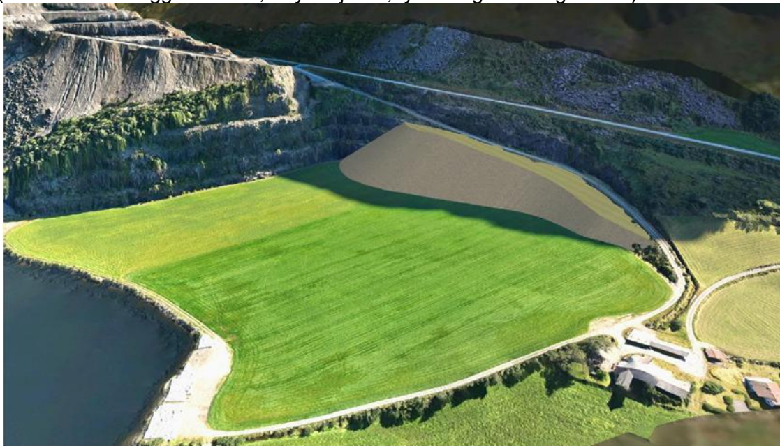
Figur 2-6 Visualisering av midlertidig lagring av masser - før tilbakeføring.

I kap. 2 vises også ønsket mellomlagringsområde for løsmasser (beige farge, ca. 12,5 dekar). (Gården Morka ligger i nedre, høyre hjørne, fylkesvegen i bakgrunnen):