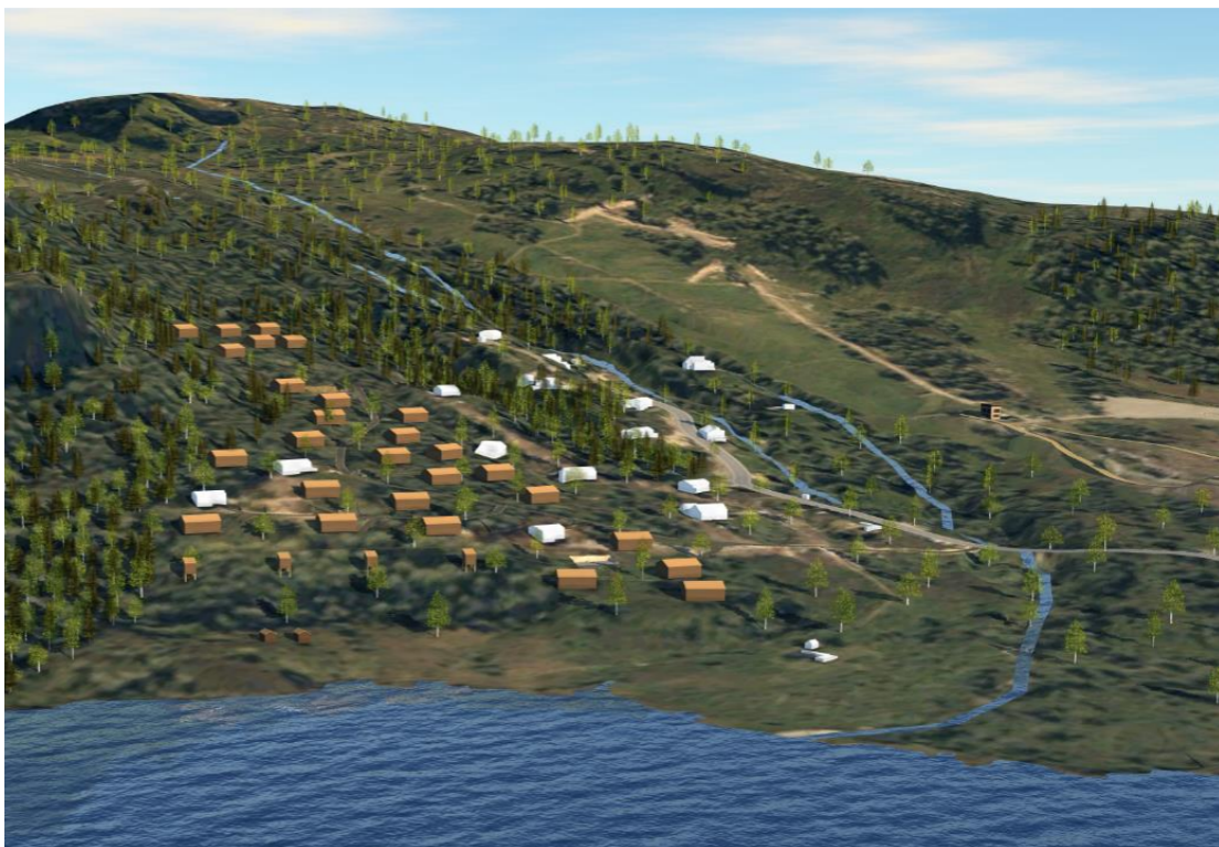
Landskapsbilde/illustrasjon (alpinanlegget er synlig i bakgrunnen). Hvite bygg er eksisterende hytter.